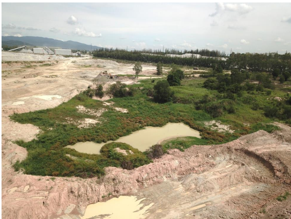
2 บ่อรับน้ำในเขตพื้นที่โครงการ

รูปที่ 1-2 (ต่อ) การใช้ประโยชน์ที่ดินบริเวณพื้นที่โครงการ