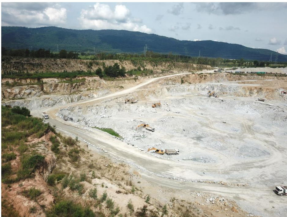
1 พื้นที่หน้าเหมืองปัจจุบัน